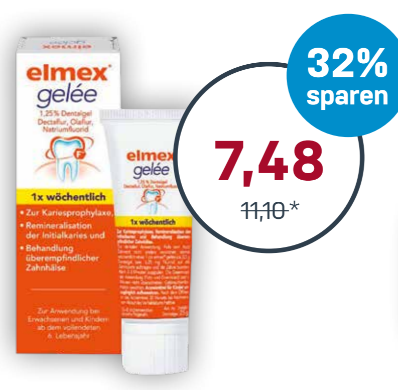
Elmex® Gelée 25 g · 100 g = 29,92 €