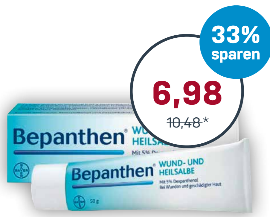
Bepanthen® Wund- und Heilsalbe 50 g · 100 g = 13,96 €