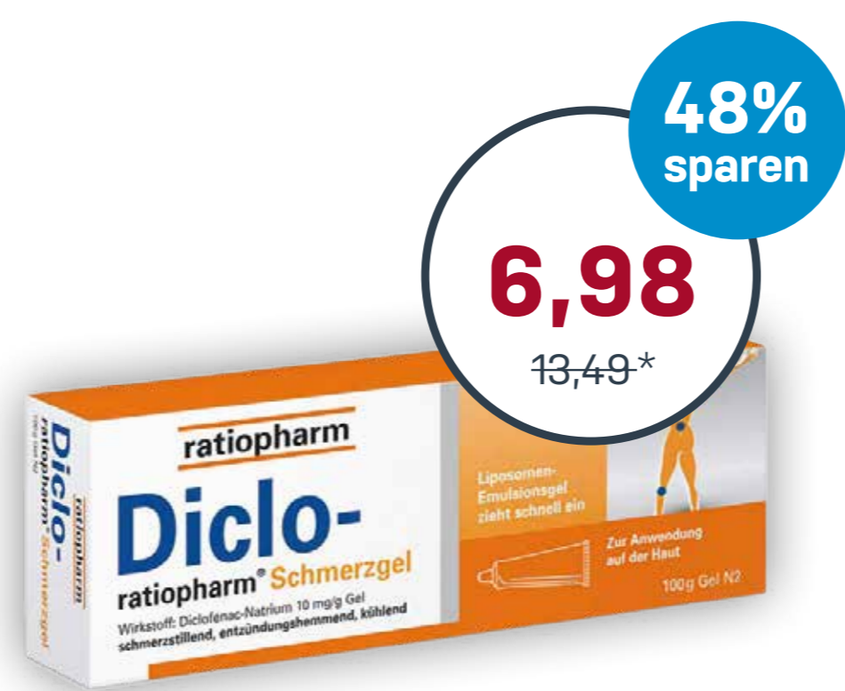
Diclo-ratiopharm® Schmerzgel · 100 g