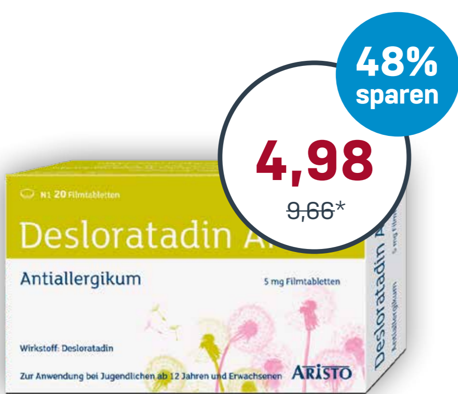
Desloratadin Aristo® 20 Filmtabletten