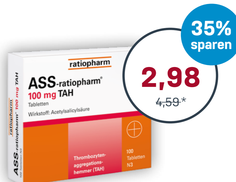
ASS-ratiopharm® 100 mg TAH 100 Tabletten