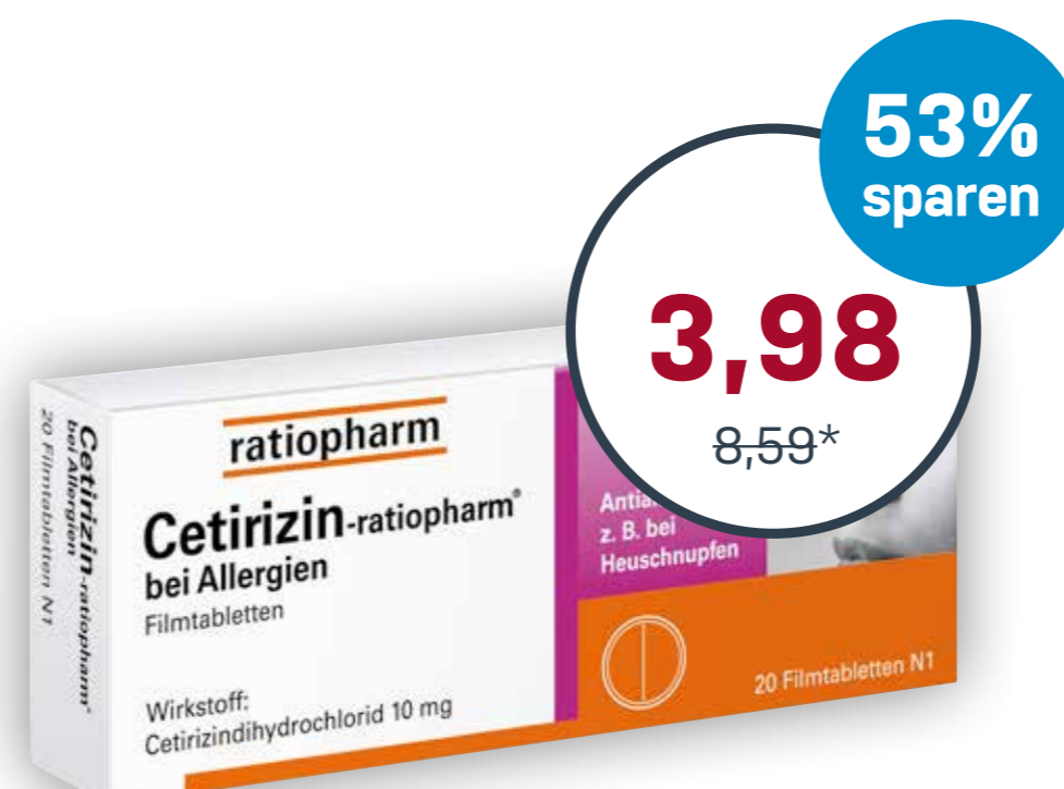
Cetirizin-ratiopharm® bei Allergien 10 mg · 20 Stück