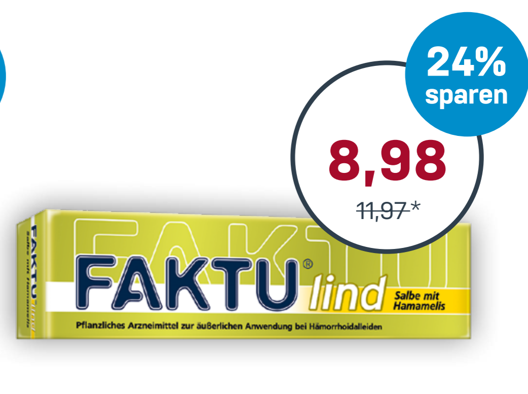
Faktu® lind Salbe mit Hamamelis 25 g · 100 g = 35,92 €