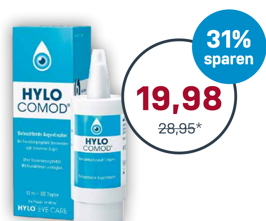
Hylo Comod® Augentropfen 2 x 10 ml · 100 ml = 99,90 €