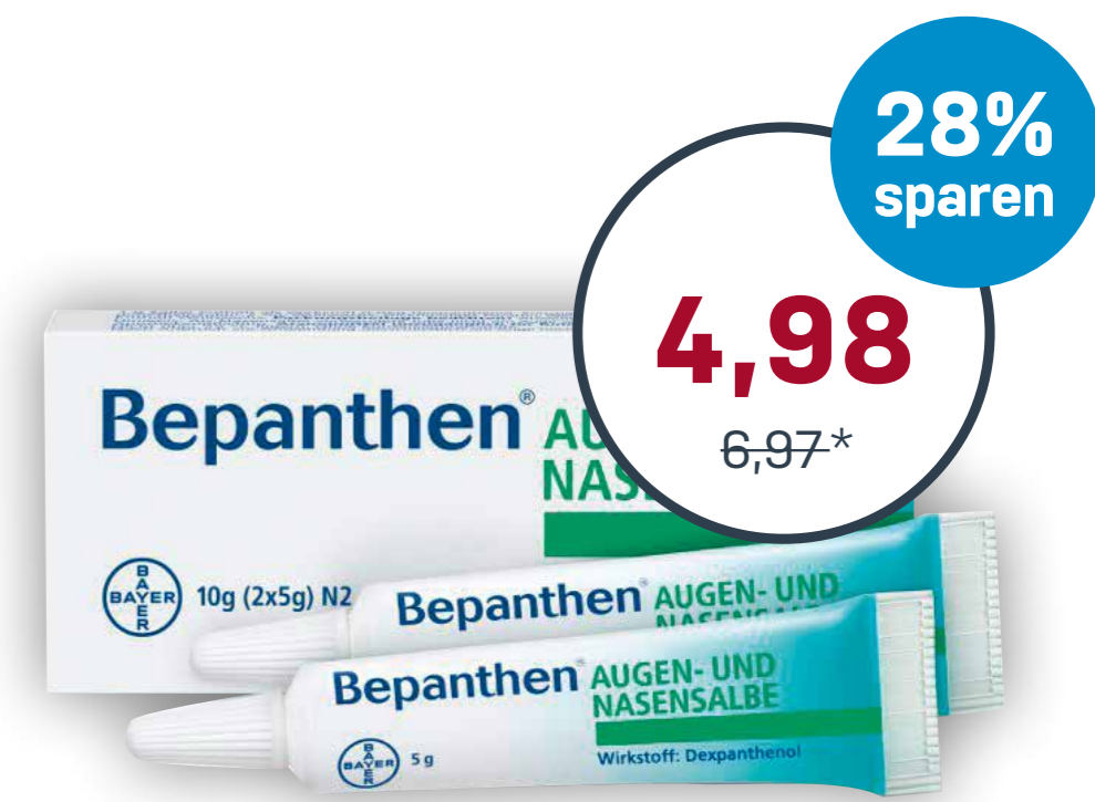
Bepanthen® Augen- und Nasensalbe 10 g · 100 g = 49,80 €