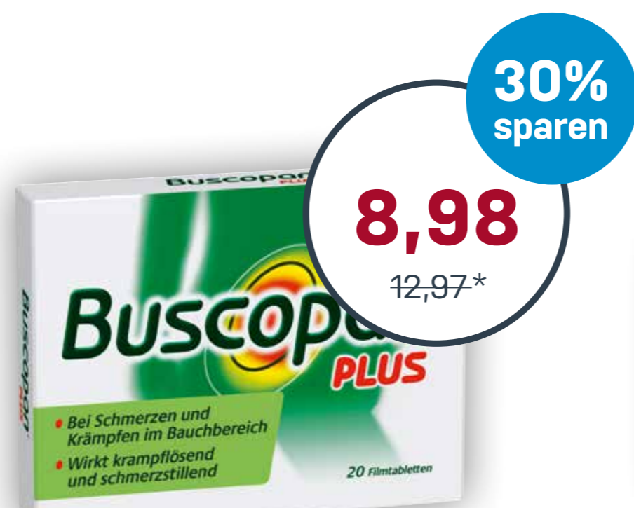
Buscopan® PLUS 20 Stück