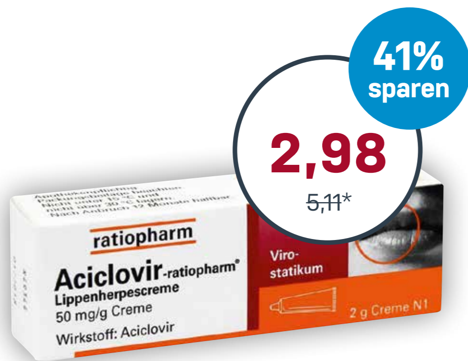
Aciclovir-ratiopharm® Lippenherpescreme · 2 g