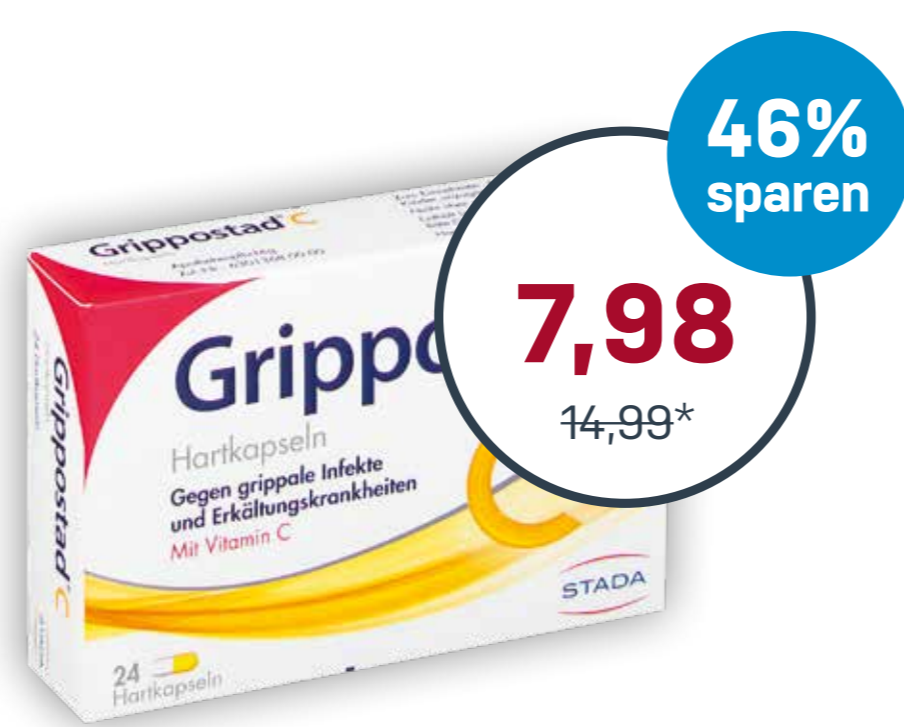
Grippostad® C 24 Kapseln