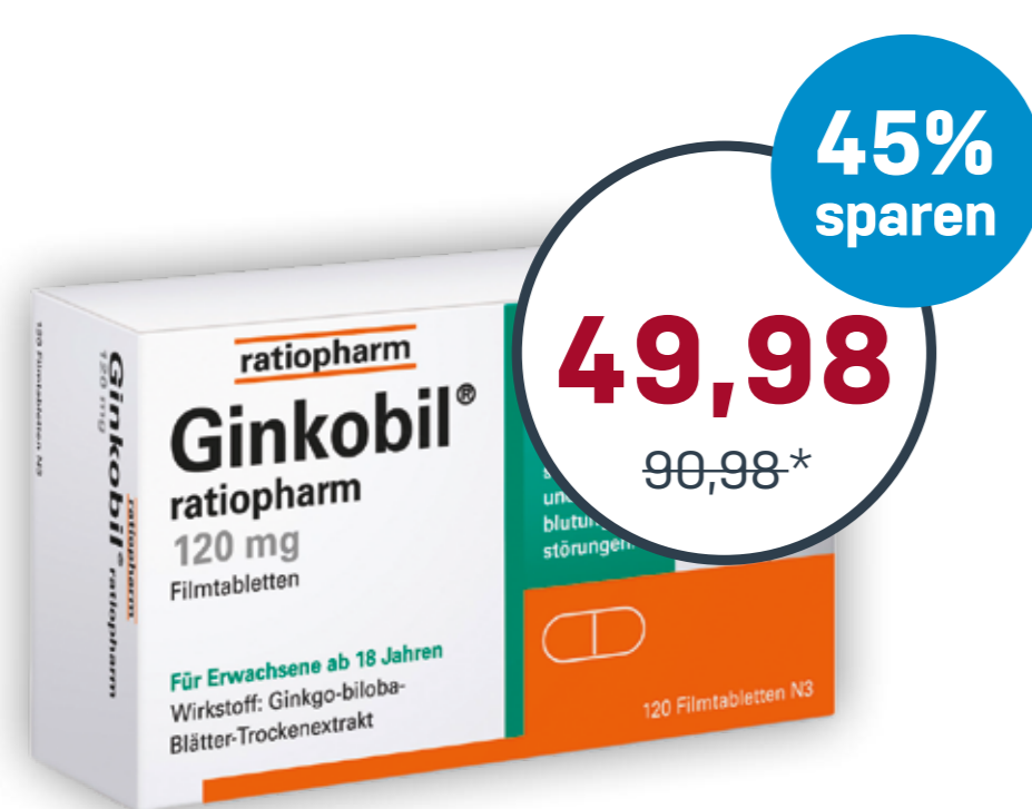
Ginkobil® ratiopharm 120 mg 120 Filmtabletten