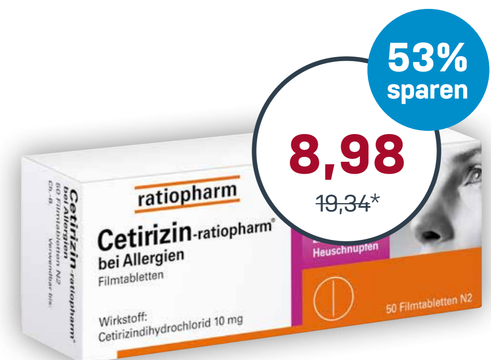
Cetirizin-ratiopharm® bei Allergien 10 mg · 50 Stück