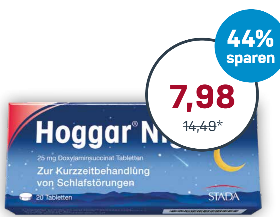
Hoggar® Night 20 Tabletten