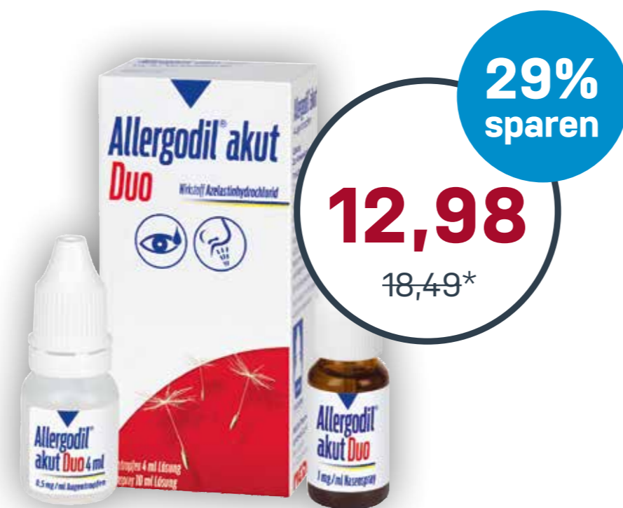
Allergodil® akut Duo 1 Stk.